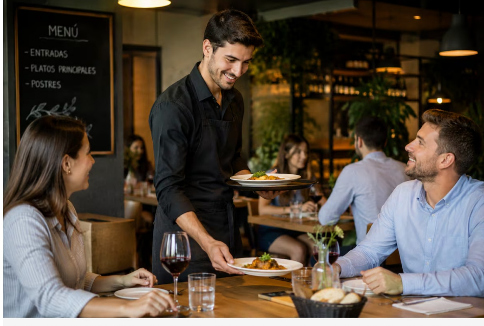
La 'ley silla' también señala una lista de sectores priorizados para su aplicación. Imagen: ChatGPT.

GE | f | X | in | WhatsApp | TikTok | Instagram