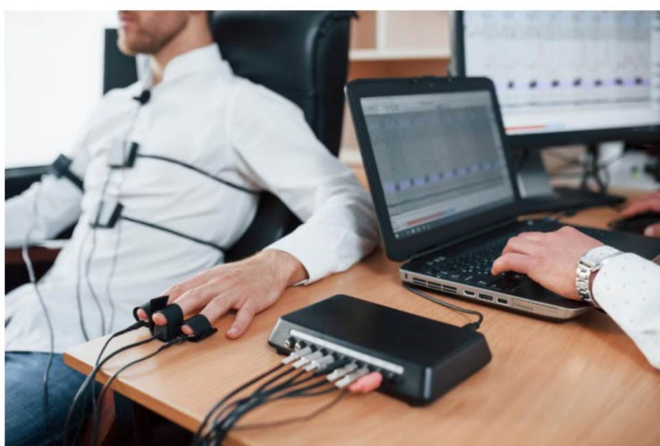
Imagen referencial de una prueba con polígrafo.